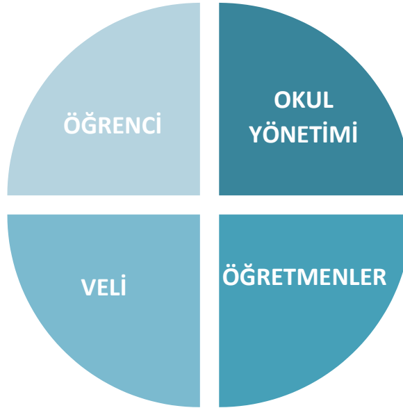
Şekil 1: Okul Temel Paydaşları

Stratejik Planlama sürecinde katılımcılığa önem veren kurumumuz tüm paydaşların görüş, talep, öneri ve desteklerinin stratejik planlama sürecine dâhil edilmesini hedeflemiştir. Bu kapsamda Mustafa Kemal İlkokulu, faaliyetleriyle ilgili sunulan hizmetlere ilişkin memnuniyetlerin saptanması, kuruma ilişkin beklentiler, kuruma ilişkin durum tespiti, kurumsal iş birliği ve eşgüdüm, GZFT, önerilerin tespiti vb. konular hakkında Mustafa Kemal İlkokulu Stratejik Planlama Ekibi ile toplantılar düzenlenmiş ve kurumumuzun temel paydaşları olan öğrenci, veli ve öğretmenlerin görüş ve önerilerini almak üzere görüşme ve anket yöntemi uygulanmıştır.